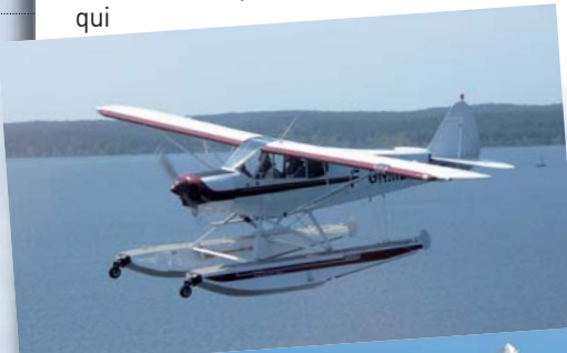
Mer ou montagne, les terrains de jeux sont multiples.

Encore plus d'informations sur les sites internet de la Fédération française aéronautique, www.ff-aero.fr et www.enviedepiloter.fr